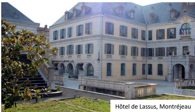
Hôtel de Lassus, Montréjeau

20 personnes étaient présentes lors de la session à Réalmont : 8 aidants familiaux et 12 professionnels issus d'établissements ou services médico-sociaux, d'association ou d'institution comme la MDPH et l'UDAF